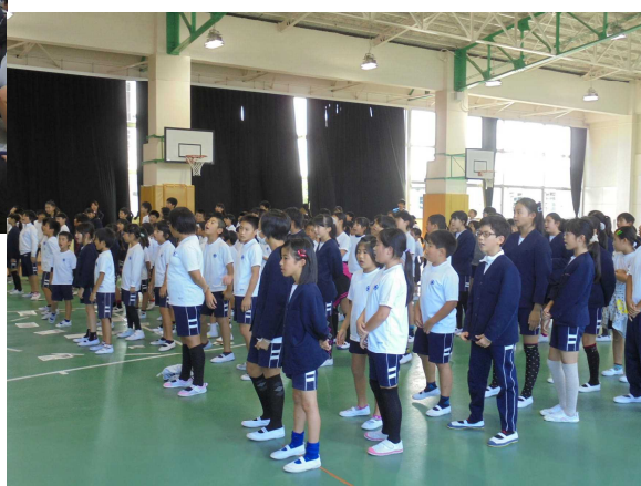
10月26日 第119回友だち集会