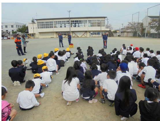
10月31日 火災避難訓練